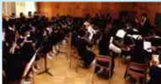
Khoa âm nhạc