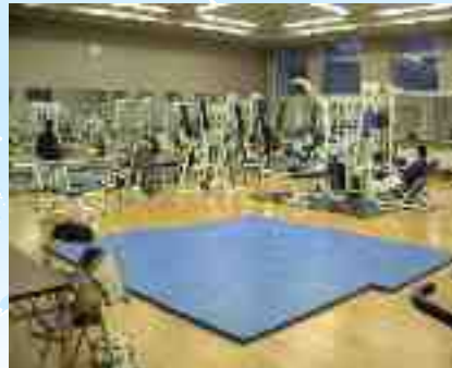
Khoa học thể thao