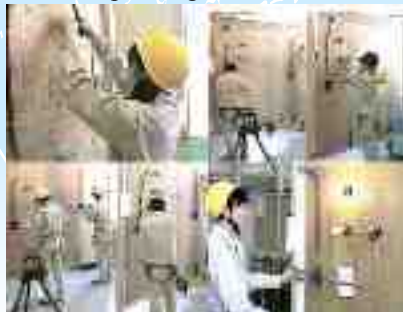
Khoa công nghiệp

Phù hợp với người đã có ước mơ và những công việc muốn làm.