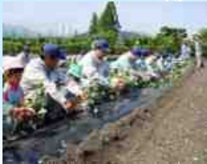
Khoa nông nghiệp