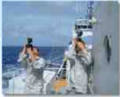
Khoa học biển