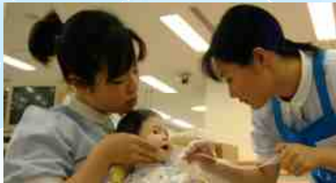
Khoa điều dưỡng