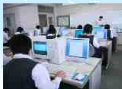
Khoa thương mại