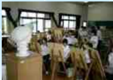
Khoa Nghệ thuật